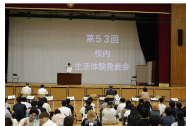
生活体験発表会 (7月9日)