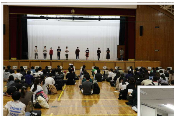
← 生徒総会 (5月28日)