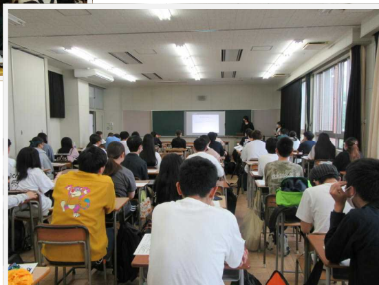
4年進路説明会 → (6月11日, 18日)