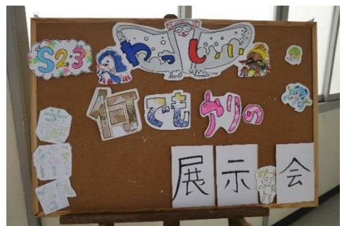
↑ 昨年のテーマ・内容 ↑

また、学校祭では展示・発表者・旭陵ステージ出演者を募集しています。過去の展示・発表では、「野球審判について」の展示や「消しごむハンコの販売とオリジナルハンコ作成販売」で参加してくれた人がいました。旭陵ステージでは「歌」「ダンス」「ミュージカル」「手品」「フルート演奏」「漫才」を披露してくれた人もいました。今年度も学校祭を一緒に盛り上げてくれるメンバーを募集します！あなたも、趣味・特技を発表しませんか？