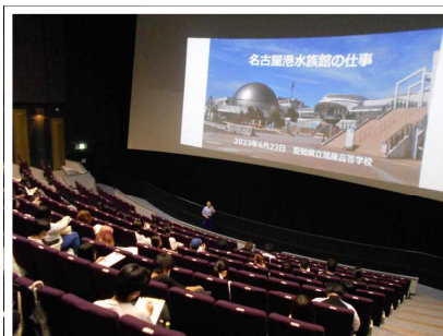
理科校外学習@名古屋港水族館 (6月30日)