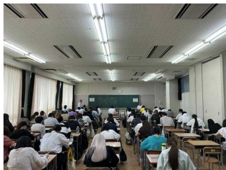
前期試験@旭丘校舎多目的教室(重複)